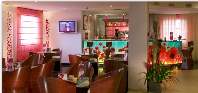
AVDA. SAN MARTIN DE VALDEIGLESIAS 4 28922 - ALCORCON

El ibis hotel en Alcorcón Tres Aguas está a 15 minutos del Centro de Madrid en transporte público. Igualmente, se encuentra a 7 km del Recinto Ferial de la Casa de Campo , el Zoo y el Parque de Atracciones.