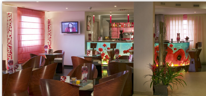
AVDA. SAN MARTÍN DE VALDEIGLESIAS, 4 / 28922 - ALCORCÓN

El ibis hotel en Alcorcón Tres Aguas está a 15 minutos del Centro de Madrid en transporte público. Igualmente, se encuentra a 7 km del Recinto Ferial de la Casa de Campo , el Zoo y el Parque de Atracciones.